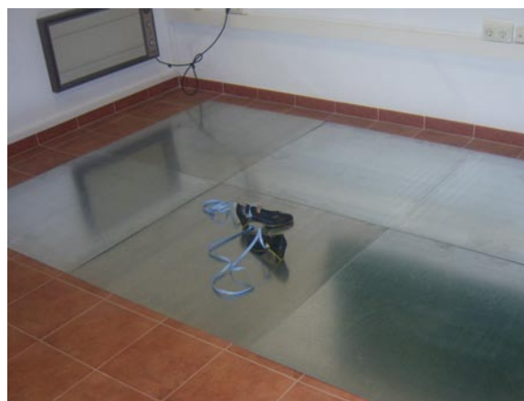
Fig. 5: Plataforma de contactos