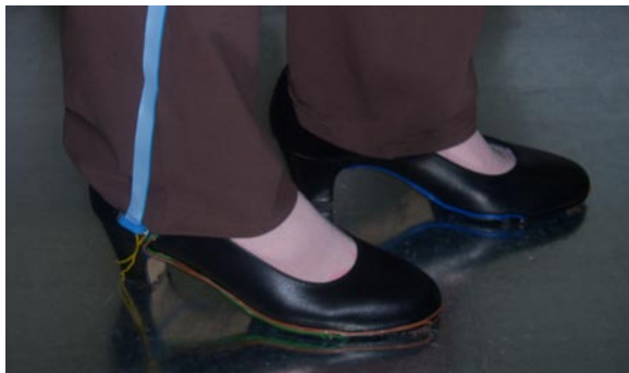
Fig. 6: El sistema preparado para el test de pulsos repetidos

que consiste en visionar uno a uno todos los fotogramas que formaban la película del baile. La cuantificación y recogida de datos se realizaba manualmente. Con este último paso se pretende comparar los resultados obtenidos mediante ambos procesos.