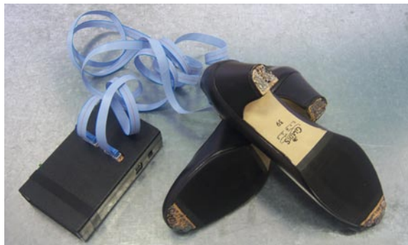
Fig. 7: El sistema preparado para el test de zapateado

que consiste en visionar uno a uno todos los fotogramas que formaban la película del baile. La cuantificación y recogida de datos se realizaba manualmente. Con este último paso se pretende comparar los resultados obtenidos mediante ambos procesos.